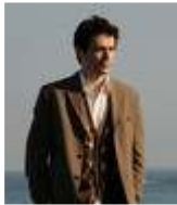
Daniel Burman | Director de Cine

En 1994 comenzó su carrera profesional en Cafés La Virginia donde se desempeñó como jefe de producto.