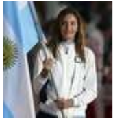
Luciana Aymar | Jugadora de Hockey

Luciana Aymar es jugadora argentina de hockey sobre césped y uno de los símbolos de Las Leonas.